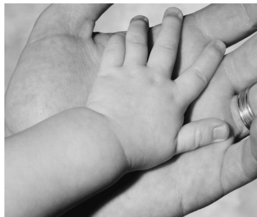
macht en vreugde : God schenkt ons zijn vrede

Dank, loof en prijs God voor Zijn vreugde.